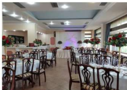
Ресторан «Алая Роза» до 120 человек