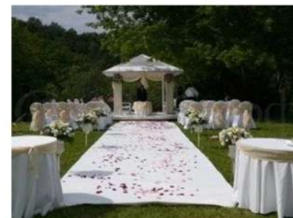
Территория парка Wadding place №1