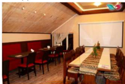
«Кают компания» до 35 человек