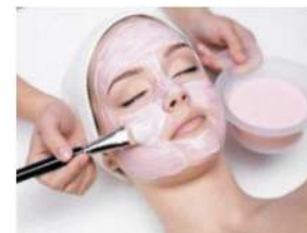
Пилинги и маски