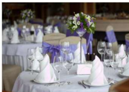
Караоке «ROZABAR» до 90 человек