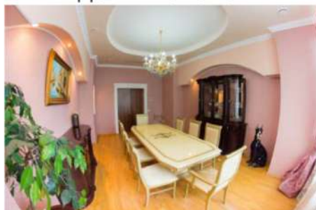
VIP зал до 12 человек